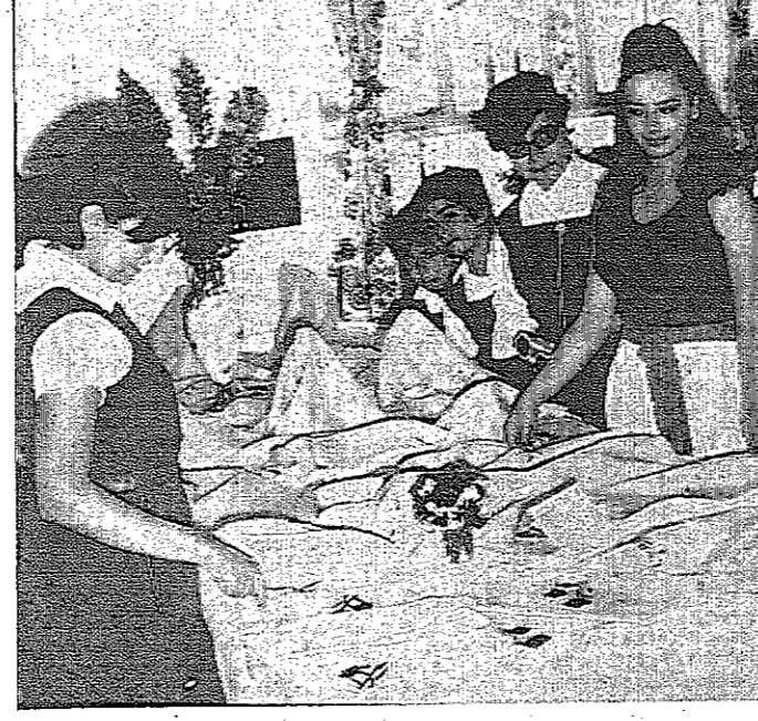
بناسبة نهاية العام الدراسي اقامت المدرسة الاهلية للبنات بيمان «س.م.اس» معرضا عرضت فيه مختلف نشاطات طالبات المدرسة من اشغال يدوية وغنون ورسومات واعمال التدبير المنزلي من صنع طالباتها في مختلف الصنوف

وقال : «آب» - حصلت وكالة الاستخبارات على تقرير سرى وضعته لجنة خاصة في مجلس الشيوخ الامريكى يشتمل على ٧٥ صفحة جاء فيه ان هناك دلائل كثيرة تثبت وقوع حوادث سرقة ورشوة واختلاس وتبذير في المشروعات التي تنفذها الولايات المتحدة في فيتنام الجنوبية حيث «تبخر ملايين الدولارات بسبب المعجز والفساد وقلة الكفاءة» . وقال : في منتصف عام ١٩٦٥ تعاقد الجيش على اذلال اصلاحات عمالية في فيتنام وكان عمالها لا يقبلون مبلغ ٢.٨٤٢٢ دولارا . ولكن التفتحات ارتفعت حتى وصلت الى ٩٩٦٢٢٦ دولارا . وطالب السناتور رايكوف بالتشامه ديوان محاسبة للاشراف على تعهدات المشروعات التي توليها الولايات المتحدة في فيتنام .